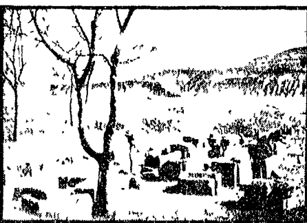
Due scorcî della città etrusca di Misa (Marzabotto)