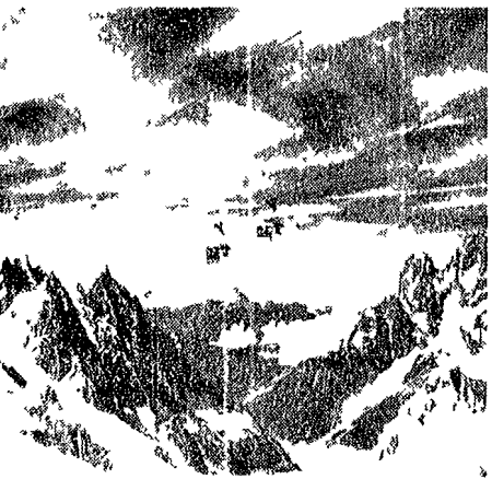
La funivia del Monte Bianco DAL CORRISPONDENTE

AOSTA agosto. Il più imponente massiccio alpino d'Europa la più lunga galleria autostradale del mondo ecco il biglietto da visita di Courmayeur.