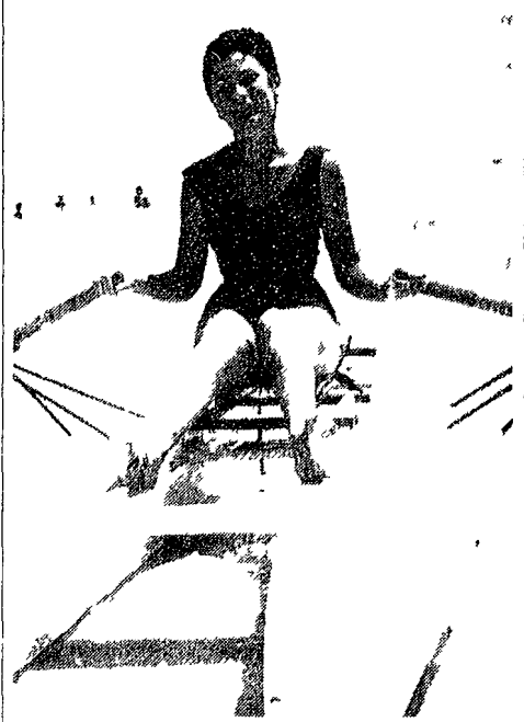
CAGLIARI - Non è una miss, ma una delle molte ragazze cagliaritanche che trascorrono le loro vacanze alla spiaggia del Poetto