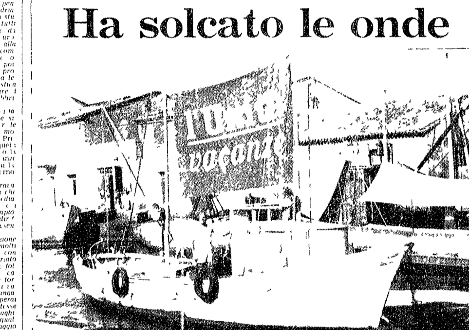
Ha solcato le onde. L'Unità vacanze ha solcato le onde. Per iniziativa di un gruppo di compagni dei motopescherecci di Cesenatico il «Dario Dante» e il «Erisio» sono usciti da porto uno costeggiando la spiaggia fino a Milano Marittima e l'altro dirigendosi a Rimini. Su ciascun motopeschereccio fra i due alberi di bordo faceva bella mostra di sé una grande tela blu riproducendo la testata de l'Unità vacanze. L'iniziativa che ha riscosso grande successo sarà ripetuta nei giorni di feragosto. E questa volta a solcare le onde lungo l'intera costa romagnola con la testata de l'Unità vacanze sarà una piccola flotta di motopescherecci.