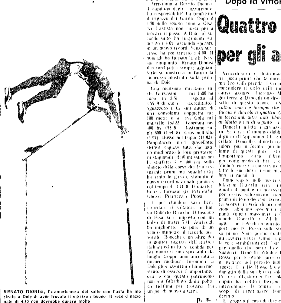
RENATO DIONISI, l'americano del salto con l'asta ha mostrato a Dole di aver trovato il passo a buano il record nazionale di 4,70 non dovrebbe durare molto

Mi sembra che gli azzurri... (text continues with details of the swimming competition results and athlete performances).