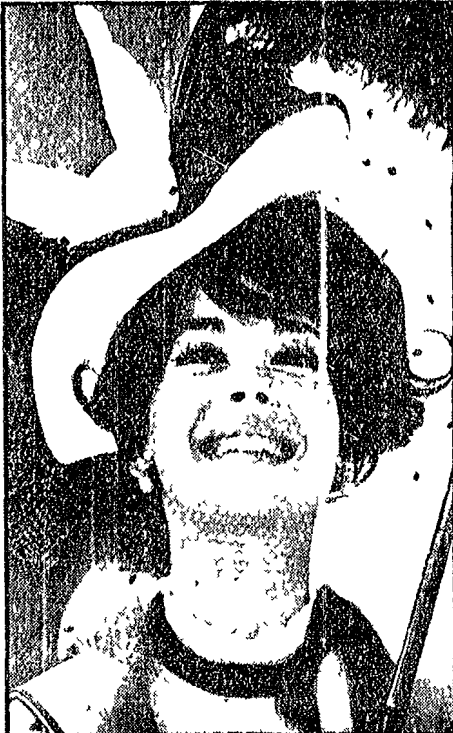
HOLLYWOOD — Natalie Wood (nella foto) sarà il protagonista di un film tratto dall'atto...