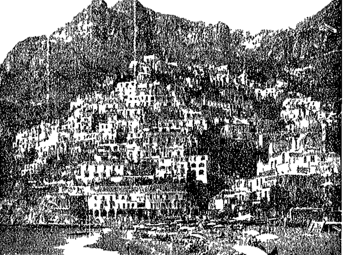
il panorama di Positano visto dal mare

Un meraviglioso viaggio a bordo di un aliscafo lungo chilometri di costa