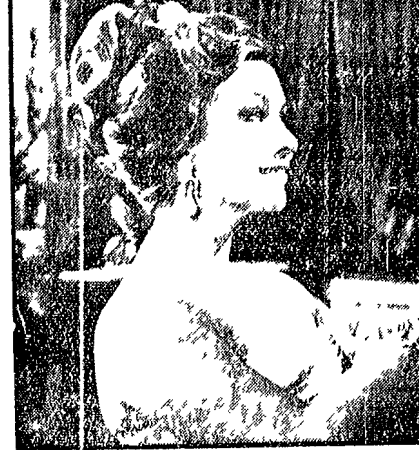
Marina Vlady e George Chakiris, in impeccabili vestiti da società, ballano un valzer si tratta di una scena del film « Il furto della Gioconda » imperniato sul furto del capolavoro di Leonardo, avvenuto nel 1911