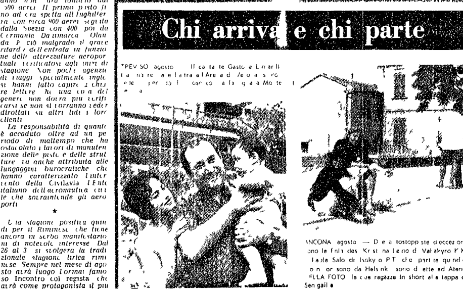
«NOCINA agosto - D e a l'ostipio ste e decce uno...»