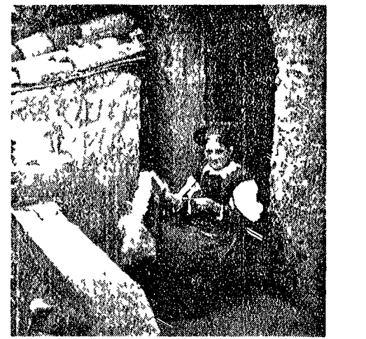
GUARDIA PIEMONTESE una donna in costume valdese

«Ognuno di questi vicoli è intitolato a un grande valdesi...»