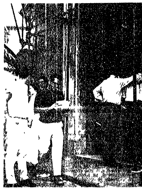
Le Cappelle Medicee

Sindacato e direzione dei Musei e Gallerie di Firenze stanno per iniziare una lunga e faticosa battaglia per la difesa dei posti di lavoro. Il sindacato, che ha già fatto sapere ai propri iscritti che la lotta sarà dura, ha già fatto sapere ai propri iscritti che la lotta sarà dura, ha già fatto sapere ai propri iscritti che la lotta sarà dura.