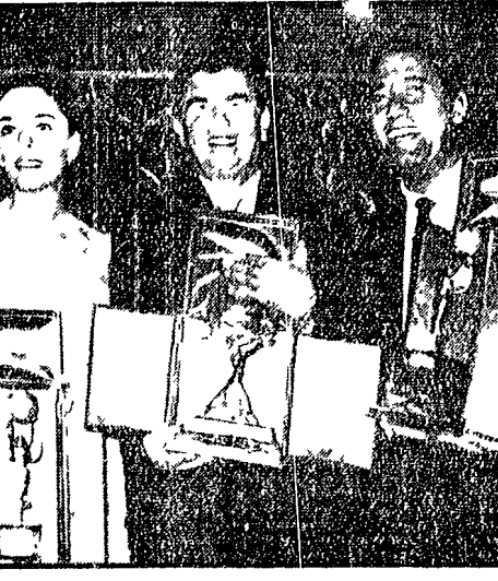
CORTINA. Ieri nelle ha avuto luogo in un nota locale di Cortina...