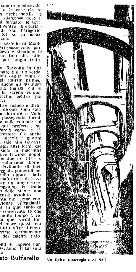
Un tipico « carrugio » di Noli

Un quattrocento metri di battente dello da « un » ampolino più al largo l'isola di « turismo » che ha fatto di Noli un centro di « turismo ».