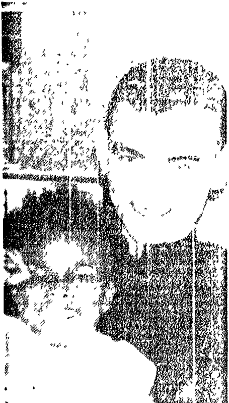
KELNE (New Haven) — Il seminarista Jonathan Daniels ucciso dal vice sceriffo Nella telefono il seminarista è con una bambina negra

Sarà rimesso domani in libertà dietro cauzione! — Il procuratore insulta le vittime e si dichiara buon amico dell'omicida — Una catena di crimini negli ultimi mesi nella zona di Selma e Haynesville