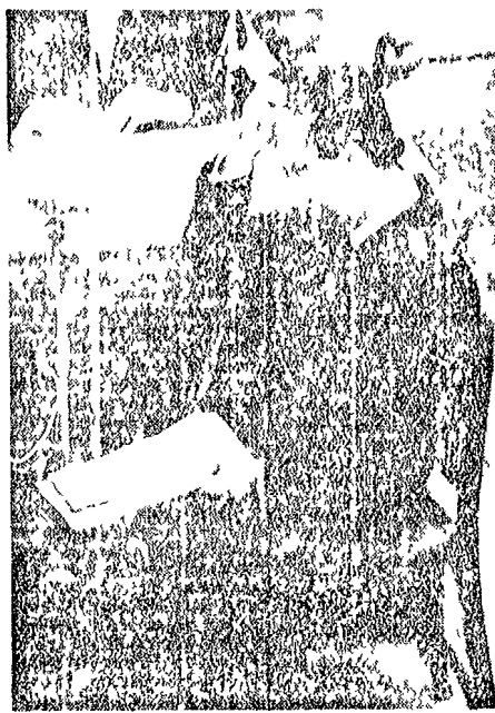
Colombo non poté smentire Ippolito agli nell'ambito dei poteri conferitigli