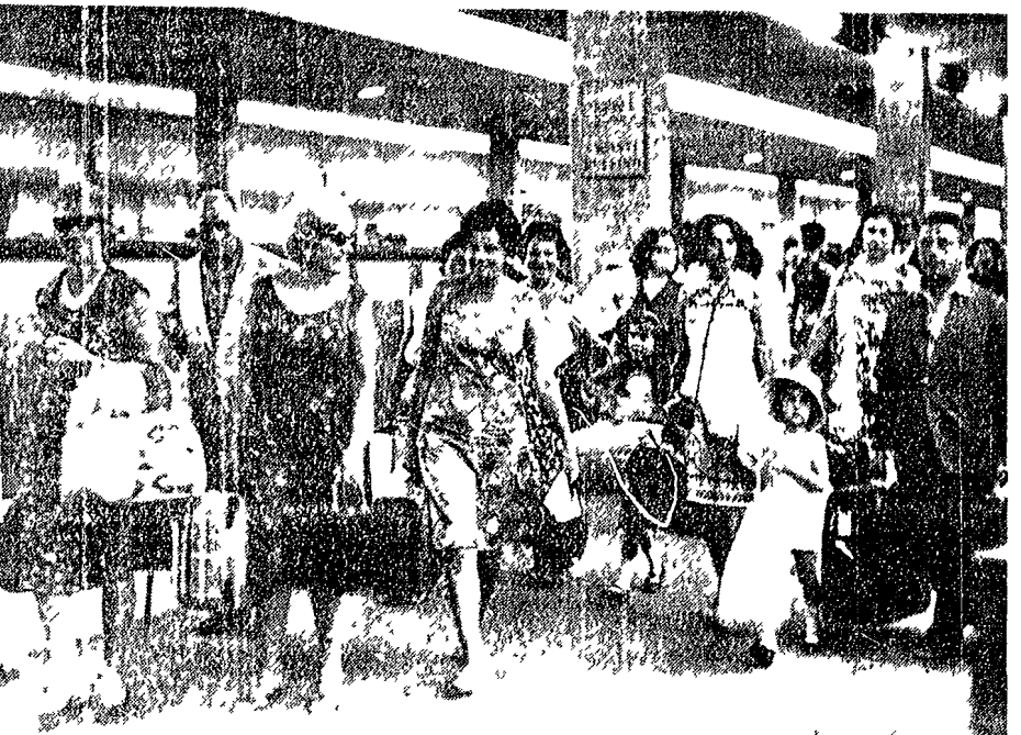
Un momento dell'ondata di persone che rientrano dalle ferie, riversandosi dai treni sui marciapiedi della stazione

La maggior parte dei fiorentini che avevano lasciato la città alla vigilia di Ferragosto, dopo una settimana di vacanze, sono rientrati in città. La città ha ripreso il suo corso normale. Gli uffici e i negozi sono aperti e la città è piena di gente. La maggior parte dei fiorentini che avevano lasciato la città alla vigilia di Ferragosto, dopo una settimana di vacanze, sono rientrati in città. La città ha ripreso il suo corso normale. Gli uffici e i negozi sono aperti e la città è piena di gente.