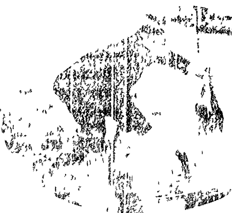
Per ora è solo un sogno (per i cacciatori) e un incubo (per le prede) di domenica potrà essere una realtà. In boc a al lupo