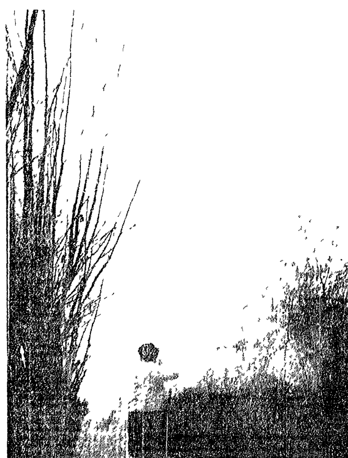
Una scena di caccia, l'anno scorso