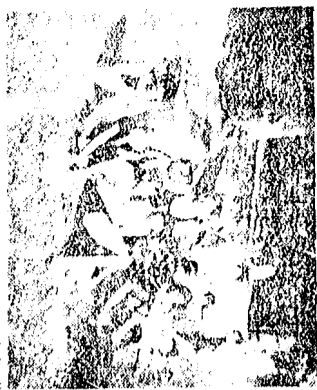
Un gruppo di italiani che hanno trascorso un periodo di vacanza a Pinerols, Cond in Jugoslavia

CIRCOLO ATOMINI Di Viareggio Il Circolo Atomini di Viareggio, che ha sede in viale Mazzini, 10, ha organizzato per il prossimo anno una serie di iniziative culturali e sportive. Tra le più interessanti, la partecipazione ad una manifestazione di solidarietà a favore dei bambini handicappati, che si svolgerà a fine maggio. Inoltre, il Circolo organizzerà una serie di corsi di avviamento al lavoro per i giovani, e una serie di iniziative di promozione culturale, come la partecipazione ad una mostra di arte contemporanea.