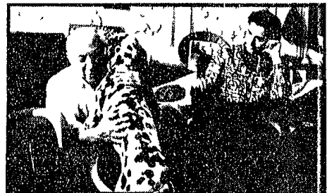
Pablo Picasso compie 60 anni: il grande pittore vive a Mougins nelle Alpi Marittime con la moglie

Il primo libro che Giuliano Procacci ha dedicato al tema della crisi dello Stato liberale è «All'origine del fascismo la crisi dello Stato». Il libro è diviso in tre parti: la prima tratta del censimento del 1911, la seconda della «privatizzazione» dello Stato, la terza della crisi industriale del 1921.