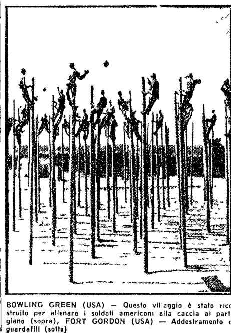
BOWLING GREEN (USA) — Questo villaggio è stato raso al suolo per allenare i soldati americani alla caccia ai partigiani (sopra), FORT GORDON (USA) — Addestramento di guardafiumi (sotto)