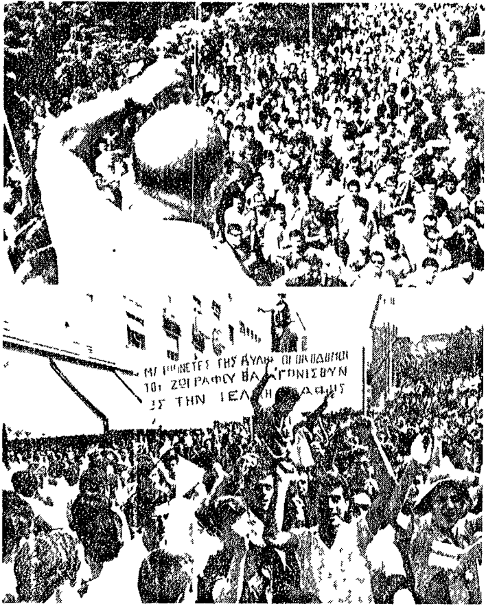
ATENE - 1.130 mila edili greci hanno attuato ieri una grande giornata di sciopero...

Costantino non è riuscito a isolare Papandreu - Le elezioni rimangono la unica via democratica - Grande manifestazione degli edili in sciopero