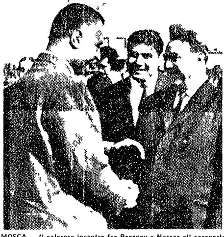
MOSCA - Il caloroso incontro fra Breznev e Nasser all'aeroporto

Il Presidente della RAU è stato accolto dai compagni Breznev, Kossighin e Mikojan - Colorosi discorsi di benvenuto al Cremlino