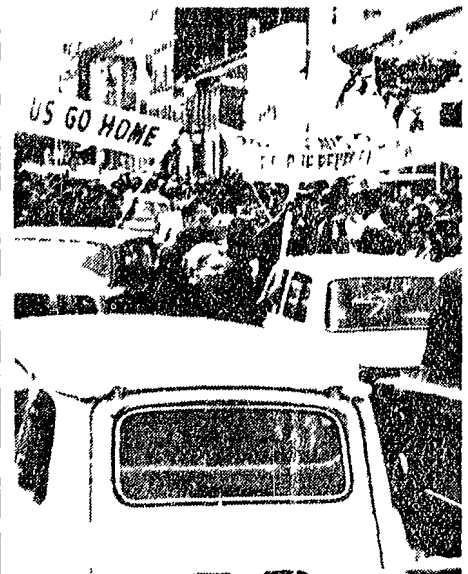
I parigini hanno accolto i delegati vietnamiti con manifestazioni antiamericane

Una importante delegazione del Partito dei lavoratori del Vietnam è ospite del Pcf a Parigi da mercoledì scorso. L'arrivo è stato accolto da una folla di parigini che hanno esultato per il nuovo gesto di indipendenza francese verso l'America.