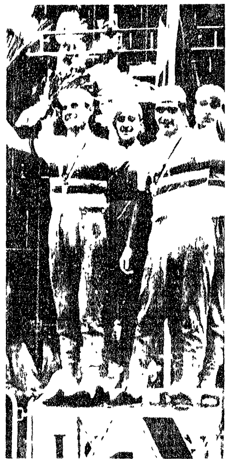
Gli azzurri sul podio dei vincitori. (L'Unità)

Dal nostro inviato SAN SEBASTIANO 2 Se la cronometro a squadre si è svolta con un successo italiano, la gara di domani, la cronometro individuale, sarà altrettanto importante. Si sa che ci sarà una lotta durissima tra i favoriti, ma la gara di domani sarà anche una gara di tattica. I favoriti sono: Dalla Bona, Guerra, Soldi, Dent, e i francesi. La gara sarà molto dura, ma i favoriti italiani hanno una buona preparazione e una buona tattica. La gara sarà molto dura, ma i favoriti italiani hanno una buona preparazione e una buona tattica.