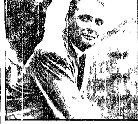
Vittorio Sereni uscirà presto una sua nuova raccolta di poesie