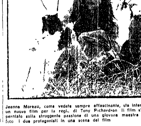
Jeanne Moreau, come vedete sempre affascinante, sta interpretando, accanto a Ettore Manni un nuovo film per la regia di Tony Richardson. Il film s'intitola «Mademoiselle» ed è un peraltro sulla struggente passione di una giovane maestra per un boscaiolo italiano. Nella foto i due protagonisti in una scena del film.