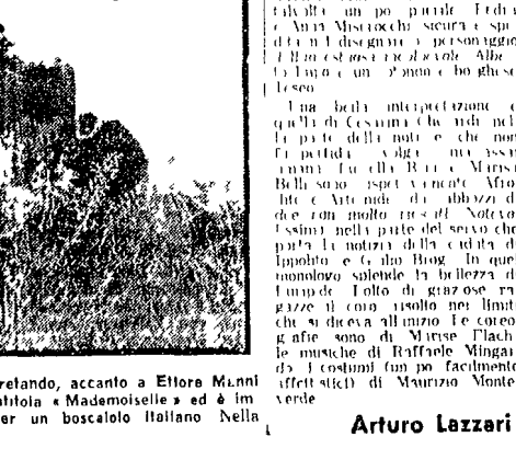
Jeanne Moreau, come vedete sempre affascinante, sta interpretando, accanto a Ettore Manni un nuovo film per la regia di Tony Richardson. Il film s'intitola «Mademoiselle» ed è un peraltro sulla struggente passione di una giovane maestra per un boscaiolo italiano. Nella foto i due protagonisti in una scena del film.

Oggi la grande «Kermesse» conclusiva al Parco Basso di Venaria