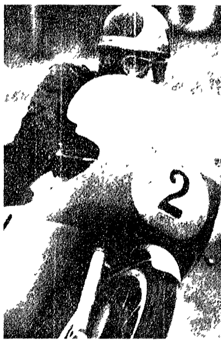
Agostini nella foto gioca oggi a Monza l'ultima carta per il mondiale

Un'ottima prova di Agostini (MV) ma è noto come stiano le cose in questa categoria. Agostini dovrà vincere non solo a Monza ma anche in Giappone e nello stesso tempo impadronirsi di un'idea (Hailwood) e un italiano (MV).