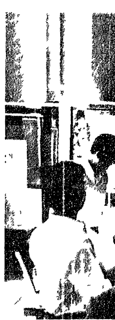
GENOVA — Vivo successo ha registrato la mostra d'arte organizzata dalla redazione genovese de «l'Unità»

Il compagno Longo ha concluso con un invito ad estendere ancora la diffusione dell'Unità specie nei luoghi di lavoro dove la classe operaia è oggi impegnata in un grande scontro per portare avanti la linea del rinnovamento democratico e socialista della società.