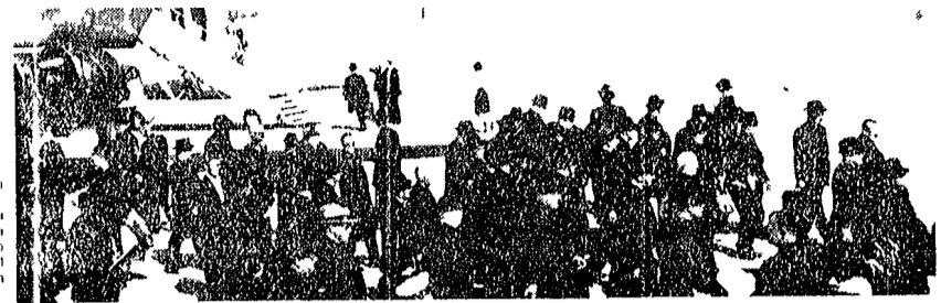
Un gruppo di sacerdoti, con il cardinale Doepfner in testa, si muove verso la basilica di San Pietro per la solenne processione per le strade di Roma.

Oggi solenne cerimonia in S. Pietro / processione per le strade di Roma - Paolo VI parteciperà ad entrambe - Significativa conferenza stampa del card. Doepfner - Un editoriale del «New York Times»