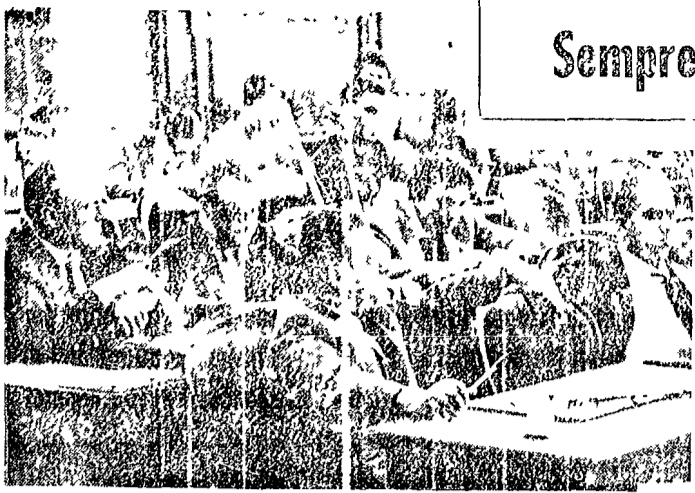
I banchi del gruppo comunista