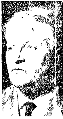
Il maestro Gavazzeni

L'inaugurazione della stagione sinfonica 1965-66 del Teatro Comunale di Firenze è affidata al maestro Carlo Maria Giulini. Il primo concerto avrà luogo il 7 ottobre alle 21.30 con il Concerto per piano e orchestra di Beethoven, eseguito dal pianista Gidon Kremer. Il direttore d'orchestra sarà Giulini.