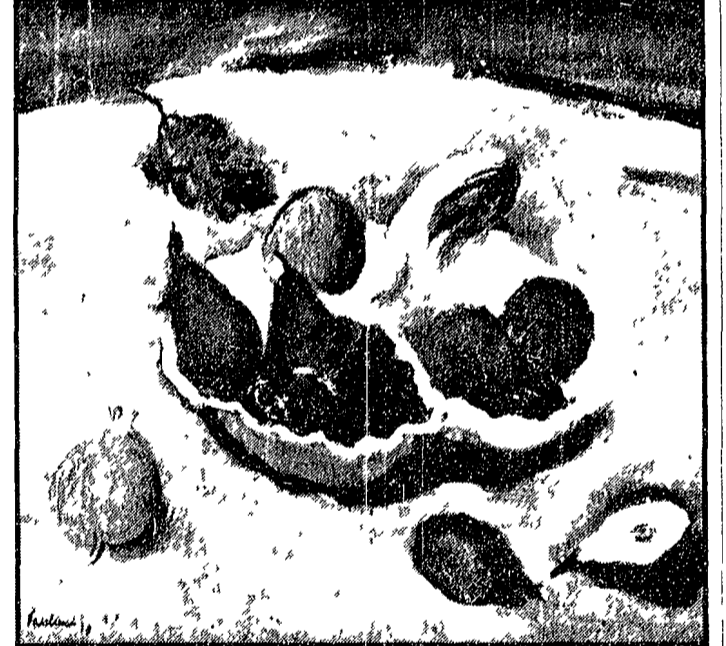
Enrico Paolucci «Natura morta» (1930)