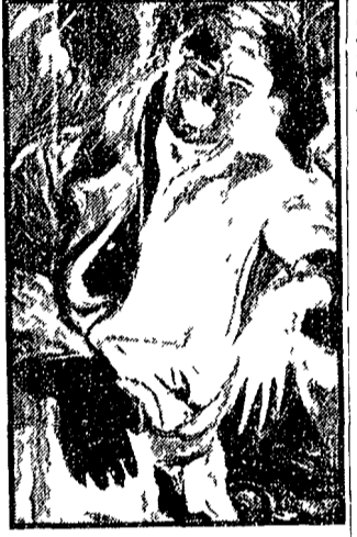
Carlo Levi «L'eroe cinese» (a destra)