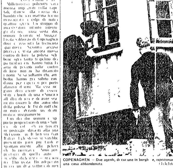
COPENAGHEN - Due agenti, di cui uno è ferito, e ispezionano una casa abbandonata.

I due uomini negano -- Un'arma e un'auto li accusano