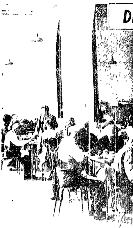
La mensa di Montedomini

«Non posso piangere: non ne trovo più la forza»