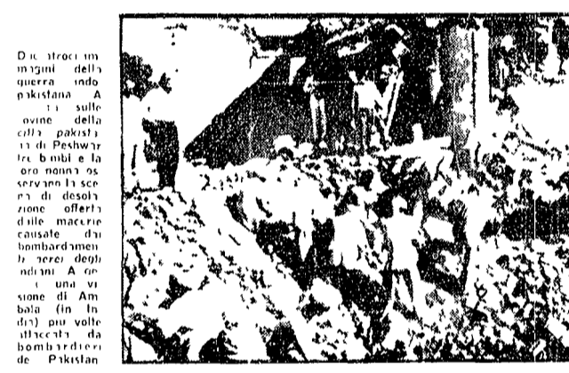
Due strati in un'immagine della guerra indo-pakistana. A sinistra: sulle rovine della città pakistana di Peshawar, bombardata e saccheggiata. A destra: una veduta di una città indiana bombardata da aerei pakistani.