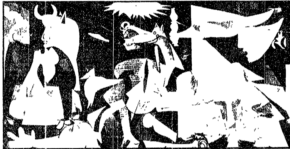
Pablo Picasso «Guernica» (1937) Guernica fu la prima città bombardata dagli aerei nazifascisti, durante la guerra civile spagnola