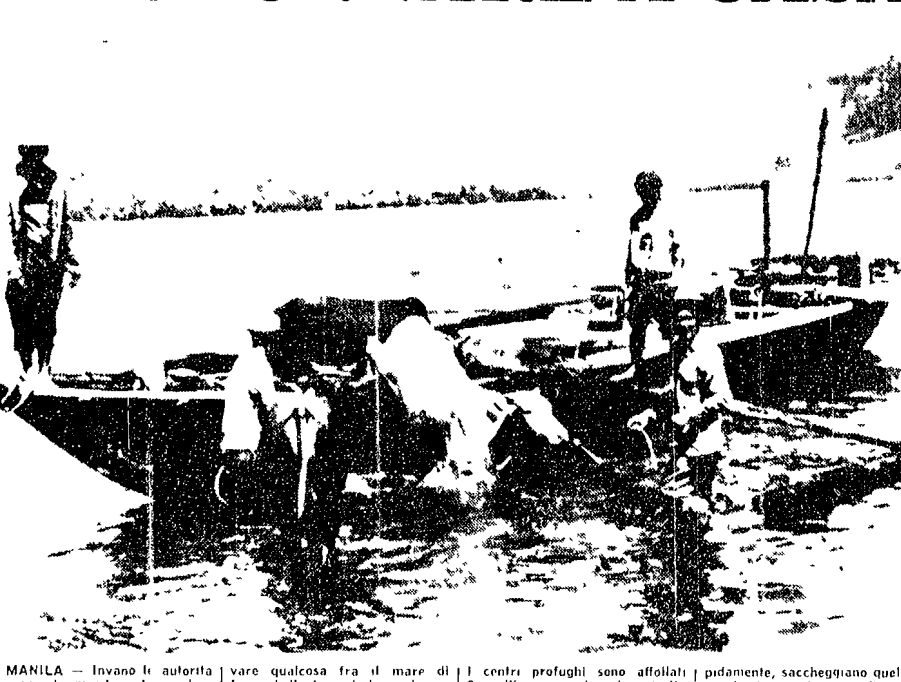
MANILA — Invano le autorità cercano di impedire che qualcuno si avventuri nell'isola di Taal...