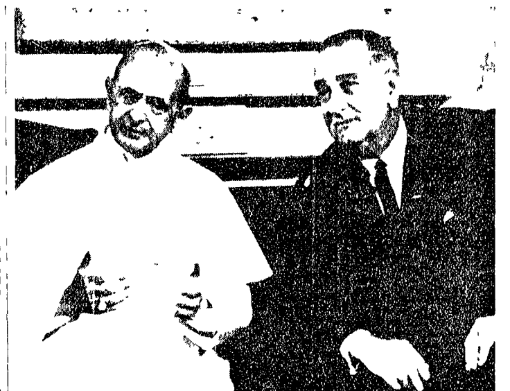
NEW YORK — Il colloquio fra Paolo VI ed il presidente Johnson al Waldorf Astoria