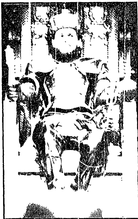
Una scena de «Il gioco dei potenti»

La serrata del Suda, provincia di Arezzo, panettieri, ha deciso di non partecipare alla manifestazione che si svolgerà dal 18 al 1° novembre al Comunale e alla Pergola. I panettieri, che hanno già inviato il loro contributo, hanno deciso di non partecipare alla manifestazione che si svolgerà dal 18 al 1° novembre al Comunale e alla Pergola. I panettieri, che hanno già inviato il loro contributo, hanno deciso di non partecipare alla manifestazione che si svolgerà dal 18 al 1° novembre al Comunale e alla Pergola.