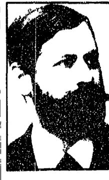
Sigmund Freud nel 1891, a trentacinque anni