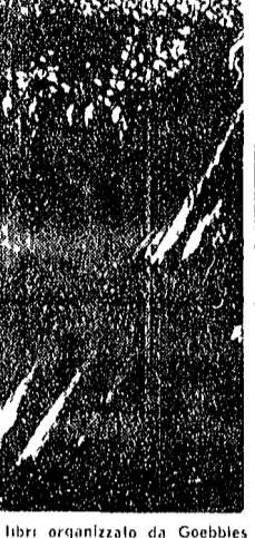
Germania, 1933 il «rogo» dei libri organizzato da Goebbels

Dagli scritti teorici di Robbe Grillet all'analisi di Jean Bloch-Michel e di Lucien Goldmann. Lo sforzo di rinnovare la struttura del romanzo in crisi - Tensione realistica o ricerca formale?