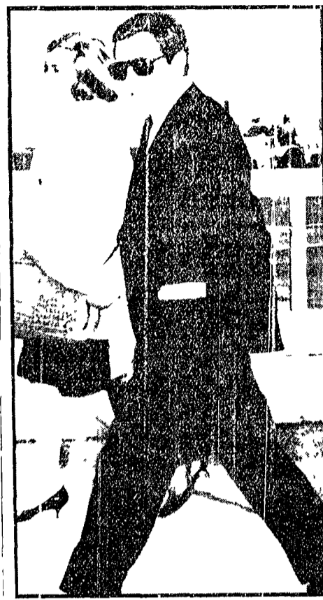
NEW YORK - Marcello Mastroianni è stato colto dall'oblietto all'aeroporto di New York... ha forse cambiato idea?