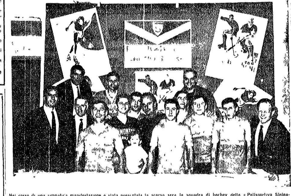
Nei corso di una simpatica manifestazione è stata presentata la scorsa sera la squadra di hockey della «Polisportiva Sinigaglia»...