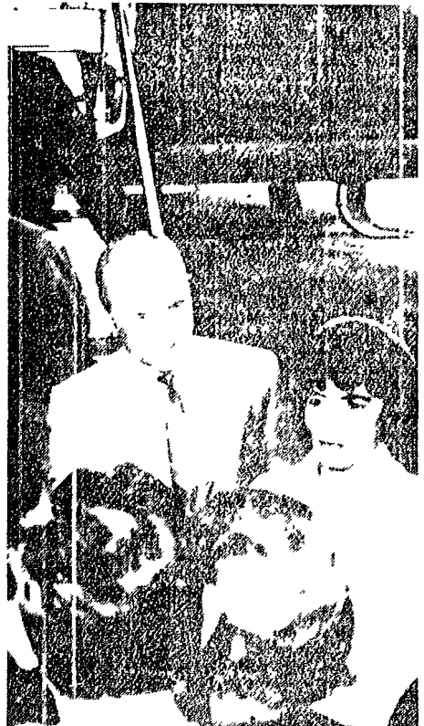
GENOVA - L'astronauta americano John Glenn accompagnato dalla moglie è arrivato ieri a Genova ed ha preso parte al XIII Convegno internazionale delle Comunicazioni. Oggi l'astronauta arriverà a Roma. Nella foto: Glenn e la moglie appena scesi dall'aereo

A Genova convegno sulle telecomunicazioni