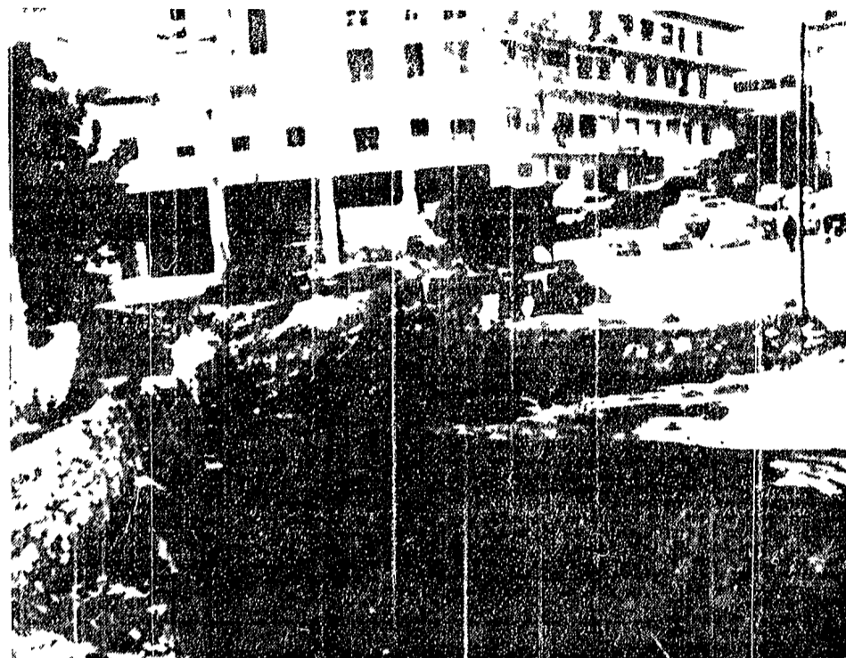
RAGUSA — Una grande voragine aperta nel centro della città a seguito del nubifragio