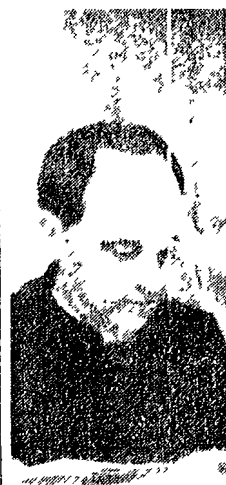
Don Lorenzo Milani