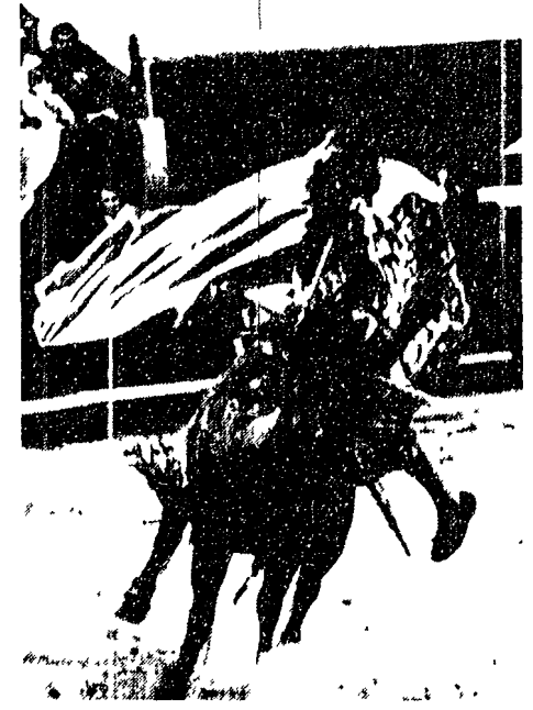
LIMA — El Cordobes, il noto torero spagnolo, si è preso una bella incornata, durante la corrida di ieri a Lima. Soccorso dal personale di Plaza Acho il matador si è potuto rialzare con i propri mezzi e ha potuto concludere il combattimento. Non si era fatto neppure una scalfittura. (L'Unità all'Unità)