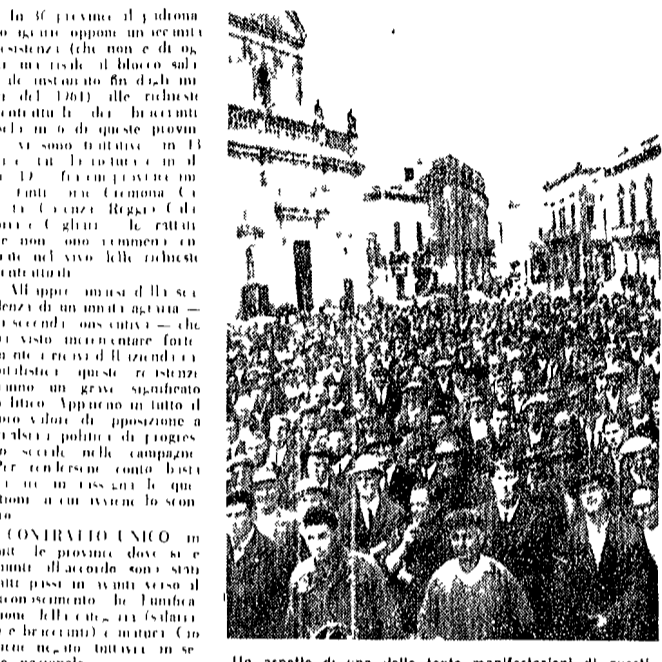
Un aspetto di una delle tante manifestazioni di questi giorni dei braccianti pugliesi