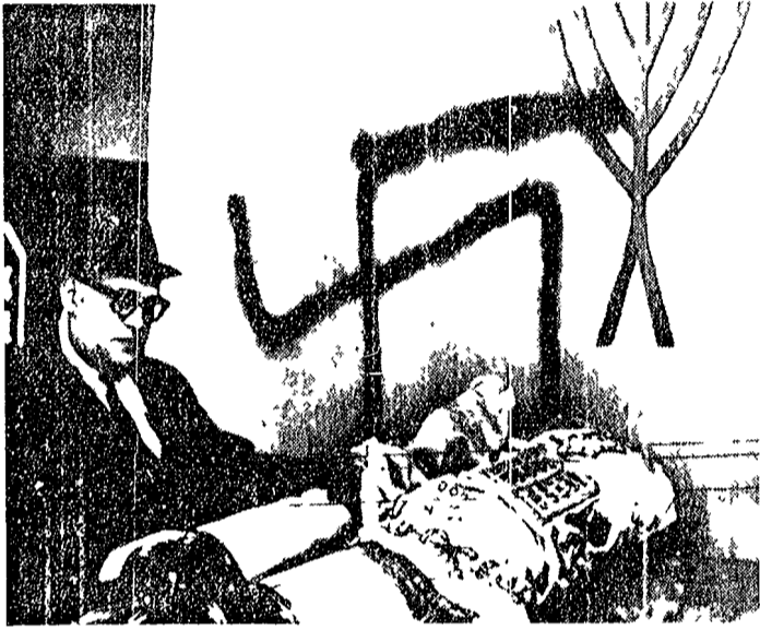
MASSACHUSETTS — Un gruppo di elementi filonazisti è penetrato nella sinagoga ebraica di Holyoke, distruggendo il santuario. Un gruppo di elementi filonazisti è penetrato nella sinagoga ebraica di Holyoke.