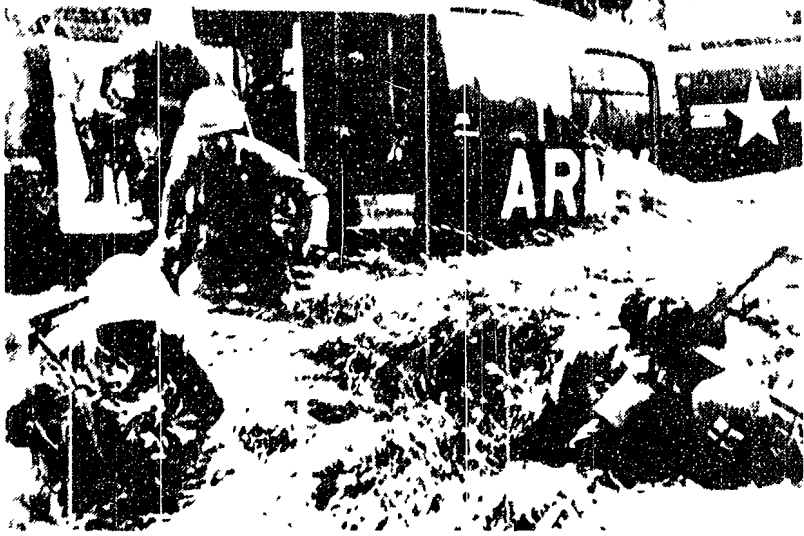
SAIGON — Parzialmente distrutto da un bombardamento aereo, un aereo militare della 125 brigata sbarcato da un elicottero che ha trasportato in una regione a nord del fiume Don Dai dove è in corso un combattimento

Fra essi, 35 militari americani - Un comunicato dell'agenzia del FNL - Un altro villaggio bombardato «per errore» da aerei USA - Numerosi apparecchi nemici abbattuti sul Nord Vietnam