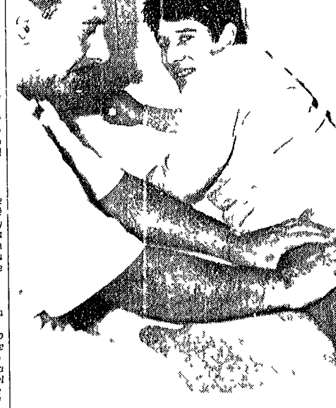
Mentre il Napoli è in ritiro a Grottaferrata in attesa della partita interna di domenica con il Torino, Omar Sivori si trova in cura a Roma per le conseguenze di un colpo al polpaccio. Il fatto che il risultato non sia quello che ci eravamo proposti è un fatto che ci eravamo proposti.

MIANO 10. «L'azione di calcio è stata molto buona», dice il tecnico della nazionale Fabbri, «ma il risultato non è stato quello che ci eravamo proposti». Il fatto che il risultato non sia quello che ci eravamo proposti è un fatto che ci eravamo proposti. Il fatto che il risultato non sia quello che ci eravamo proposti è un fatto che ci eravamo proposti.