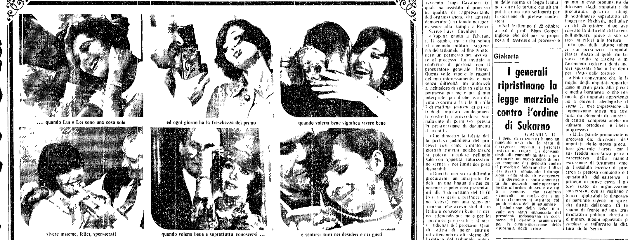
... quando Lui e Lei sono una cosa sola

Il processo ai 14 giovani iraniani è stato caratterizzato da ostacoli e irregolarità. Gli avvocati democratici hanno denunciato le torture inflitte ai prigionieri e l'assenza di prove contro gli imputati. Il processo si svolge a Teheran e ha attirato l'attenzione internazionale. Gli imputati sono accusati di appartenere a un gruppo di oppositori politici. Il governo iraniano ha respinto le accuse di torture e ha sostenuto che gli imputati sono colpevoli. Il processo è stato interrotto più volte a causa di ostacoli agli avvocati. Gli avvocati hanno denunciato ricatti e telefonate anonime contro gli interpreti. Il processo è ancora in corso e si attende un verdetto.