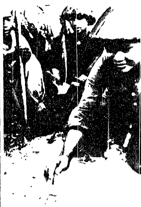
Da una zona libera del Vietnam meridionale l'agenzia Nuova Cina ha diffuso la presente telefoto...