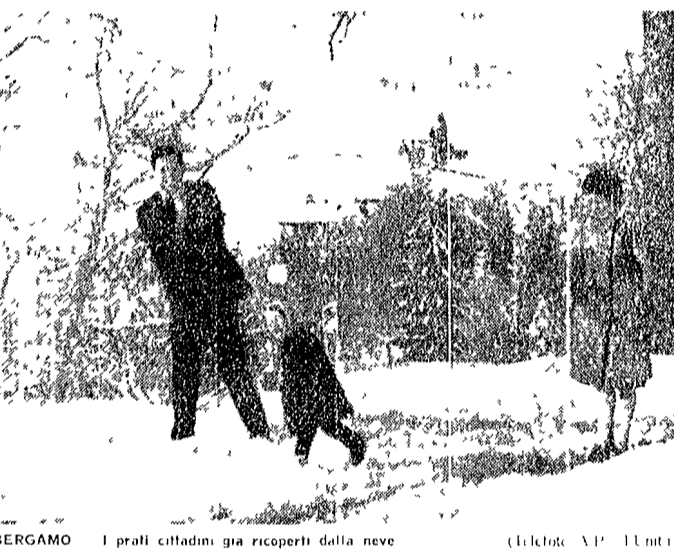
BERGAMO I prati cittadini già ricoperti dalla neve

L'ondata di freddo che si è abbattuta sull'Europa comincia a scendere verso l'Italia. Sul fronte Dolomiti centrali il termometro è sceso la scorsa notte a 15 gradi sotto lo zero a Dobbiaco, a meno 10 a Misurina e sui pascoli alpini, a meno 8 a Corvara. La neve caduta ieri ha già raggiunto i quaranta centimetri al passo del Falsarego, 50 sul Poiedo.