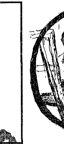
Lovis Corinth «Autoritratto» (fotografia, 1917)