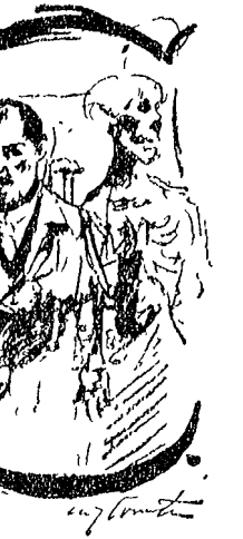
Lovis Corinth «Autoritratto» (fotografia, 1917)

Il convegno di Perugia è stato un'occasione di una discussione di legge generativa di recente divulgazione.