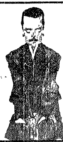
Egon Schiele e Ritratto di Eduard Kosmack

Il convegno di Perugia è stato un'occasione di una discussione di legge generativa di recente divulgazione.