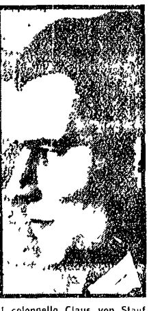
Il colonnello Claus von Stauffenberg

Il convegno di Perugia è stato un'occasione di una discussione di legge generativa di recente divulgazione.