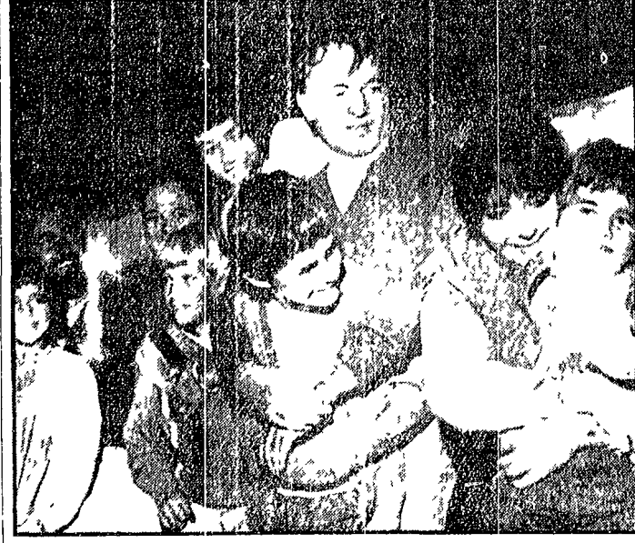
NEW YORK — La 20th Century Fox ha chiesto un risarcimento di 50 milioni di dollari (30 miliardi di lire) a Elizabeth Taylor e a Richard Burton, sostenendo che «Dito nell'occhio» è un'opera di plagio.

BRACCIO DI FERRO di Bud Sagendorf. Una serie di vignette satiriche che ritraggono la vita quotidiana con umorismo e ironia.